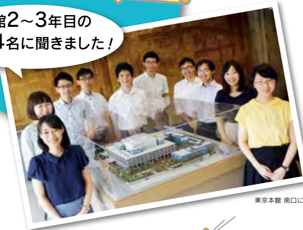
東京本館 南口にて

※国立国会図書館ホームページ「採用情報」では、職員採用試験合格者(採用予定者)のアンケート・合格体験記として、合格者の志望動機や試験対策を紹介しています。