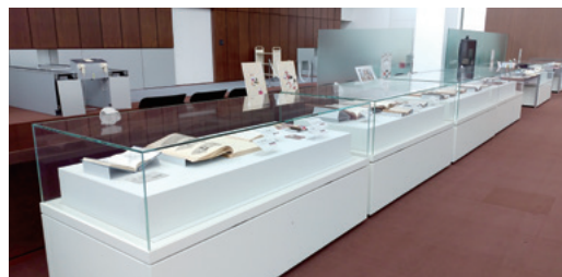
過去の資料展示の様子

詳細は https://www.ndl.go.jp/jp/kansai/events/index.html に掲載予定