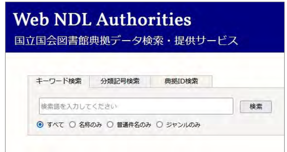
Web NDL Authorities