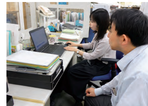
同僚と日々のサービス改善について相談