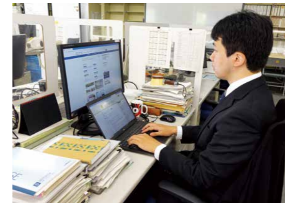
担当するシステムについて不具合がないか確認

から寄せられた質問や調査依頼への回答の記録等を蓄積している「レファレンス協同データベース」( https://crd.ndl.go.jp/ )のリニューアルです。より便利にすべく、デザインの刷新や機能追加等の改善を行います。私は企画段階から携わっていますが、館内外からの改修要望が、開発が進む中でシステム上に具現化される過程を経験できることに、やりがいを覚えます。