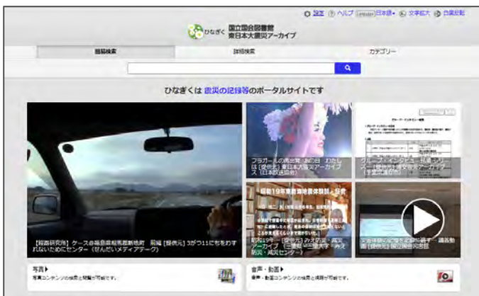
図 1 ひなぎくトップページ ( http://kn.ndl.go.jp/ )

国立研究開発法人防災科学技術研究所は、これまでも東日本大震災被災地域の津波の碑のコンテンツをはじめとする災害情報を国立国会図書館のひなぎくに提供してきました。この度、国立国会図書館と連携協力協定を締結することで、災害情報の提供のみならず、収集された災害情報を利活用し、地域の災害の危険性を歴史的、空間的に把握し、類似市区町村の災害履歴や防災の取組を参考にし、自らの地域の防災の参考にすることができる地域防災 Web（ https://trial.all-bosai.jp/allbosaiweb/ ）をさらに充実させ、地域防災対策の促進を図っていきたいと考えています（図 2）。