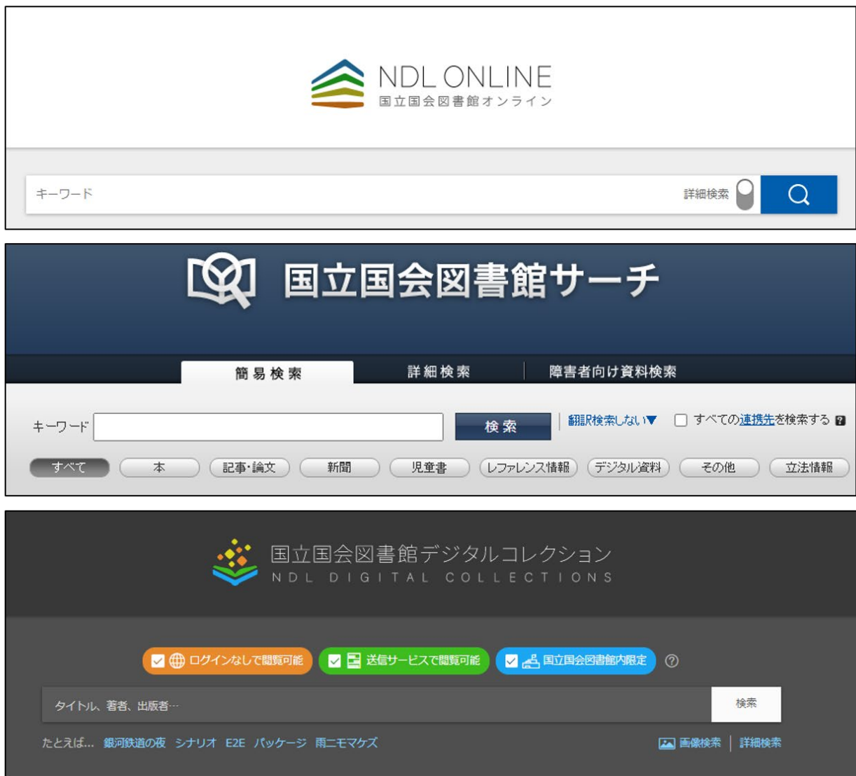
図6 国立国会図書館オンライン、国立国会図書館サーチ、デジタルコレクションのトップページ

■ 問合せ先：国立国会図書館 総務部総務課広報係 TEL：03-3506-5103（直通）