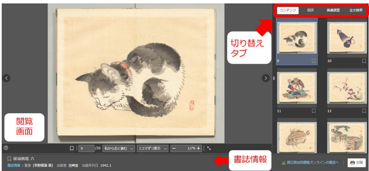
図3 デジタルコレクションの閲覧画面と切り替えタブ

書誌情報の表示位置を変更し、 コンテンツの閲覧画面を大きくできる ようにしました。また、サムネイル、目次、画像調整等の機能をタブで切り替えられるようになりました。サムネイルの大きさも自由に変えることができ、サムネイルからページ選択がしやすくなりました。