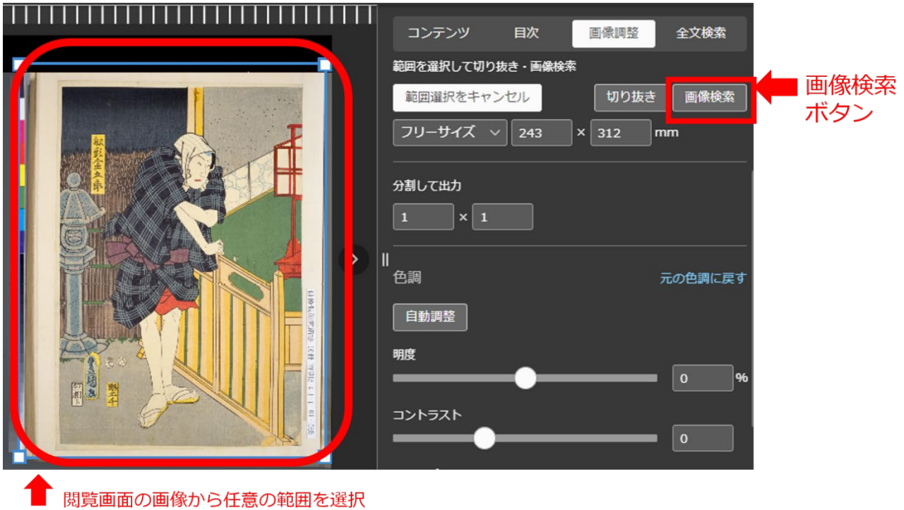
図4 デジタルコレクションの閲覧画面での画像検索

デジタルコレクションから切り取った画像やお手持ちの画像、またはウェブ上にある画像を使って、デジタルコレクションに収録されているインターネット公開（保護期間満了）の図書・古典籍の中から類似の図版（図、挿絵、写真等）を検索することが可能となりました。