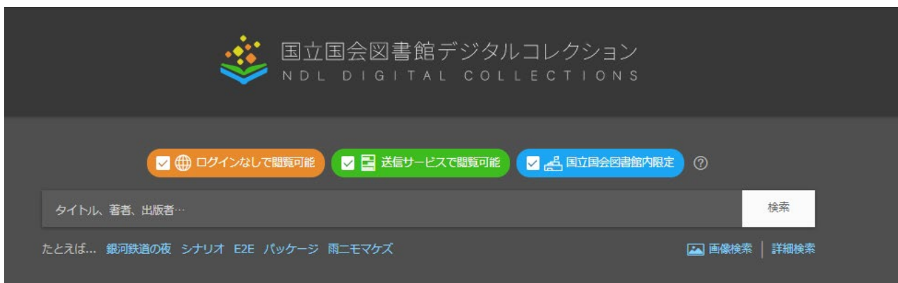
図1 デジタルコレクションのトップページ

国立国会図書館は、令和4年12月21日（水）に、当館等が所蔵資料をデジタル化した「デジタル化資料」約311万点と収集した「電子書籍・電子雑誌等」約150万点を検索・閲覧・視聴できる「国立国会図書館デジタルコレクション」（以下「デジタルコレクション」）（ https://dl.ndl.go.jp/ ）をリニューアルしました。求める情報がより探しやすく、またより閲覧しやすくなりました。調べものや趣味・娯楽のために、より便利になったデジタルコレクションをぜひご活用ください。